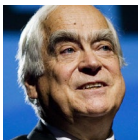
Prof. Dr. Peter Eigen Gründer von Transparency International